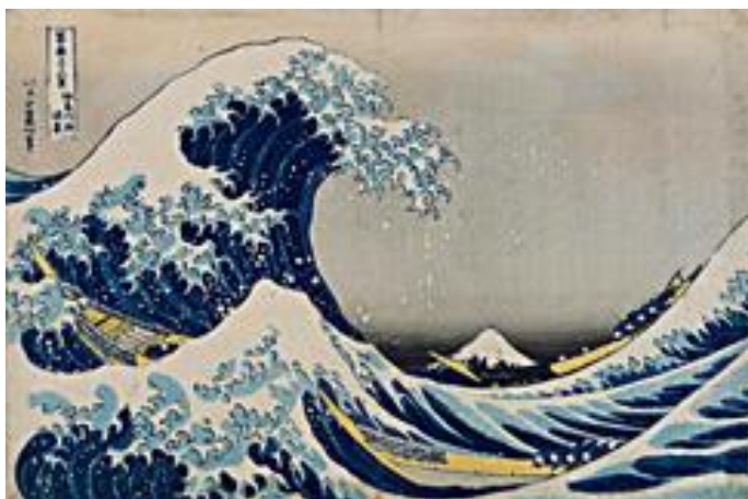
Site de la Bibliothèque national de France (bnf.fr)